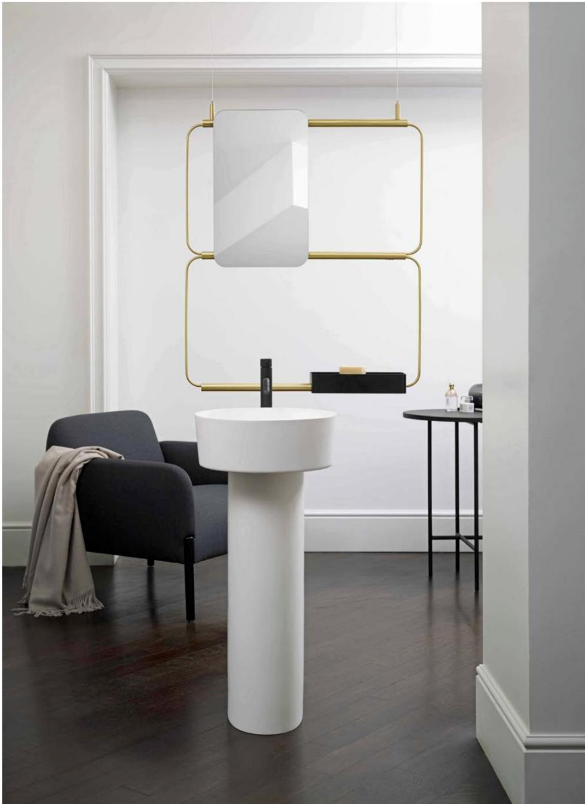
Le système polyvalent Nudo permet une pose suspendue ou murale et se compose d'une série de modules à deux dimensions, en acier noir ou laiton. Au choix, il peut être utilisé en porte-objets, porte-serviettes ou en miroir personnalisable. Design Mut. ©Ex.t