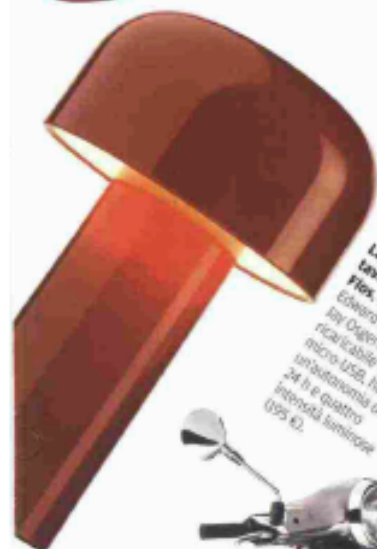
Lampada da tavolo Felix Edward Barber e Jay Ogerton, il ricaricabile è micro-USB, ha un'autonomia di 24 h e quattro intensità luminose (295 €).