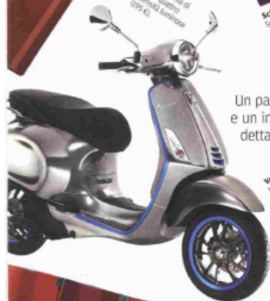
Vespa elettrica, ha un'autonomia fino a 100 km, zero emissioni di CO2 e si ricarica in quattro ore (6.390 €).

Un paravento che riscalda, una borsa che gioca a scacchi e un inchiostro che sa farsi notare. A tutto campo o come dettaglio, il rosso concentra l'attenzione sugli accessori.