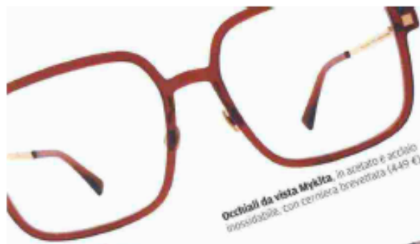
Occhiali da vista Mykita, in acetato e acciaio inossidabile, con cerniera brevettata (449 €).