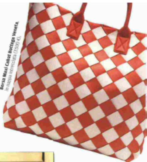
Borsa Mavi Cabat Bottega Veneta, in nuova tessitura (2.500 €).