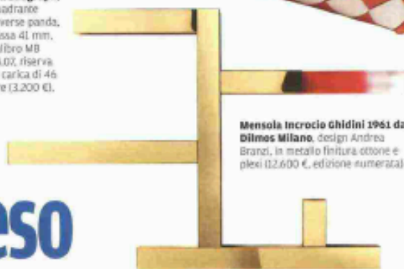
Mensola Incrocio Ghidini 1961 da Dilmos Milano, design Andrea Branzi, in metallo finitura ottone e plexi (2.600 €, edizione numerata).