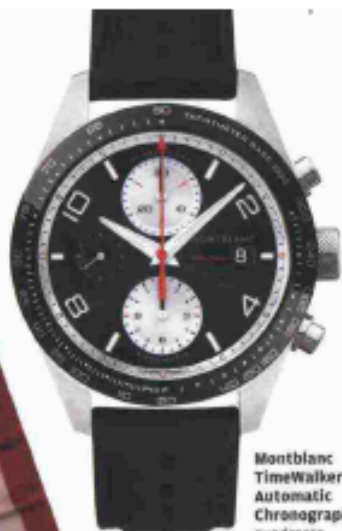
Montblanc TimeWalker Automatic Chronograph, quadrante reverse panda, cassa 41 mm, calibro MB 25.07, riserva di carica di 46 ore (3.200 €).