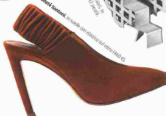
Décolleté Santoni, in suede con elastico sul retro (460 €).