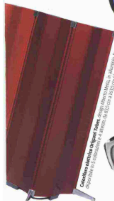
Calorifero elettrico Origami Tubes, design Alberto Meda, in alluminio, con scambiatore a 5 colorazioni e 4 alture, da 80,5 cm a 103,5 cm (692,2196 €).