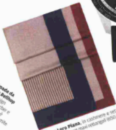
Sciarpa Loro Piana, in cashmere e seta Soffio Stampati con maxi rettangoli (650 €).