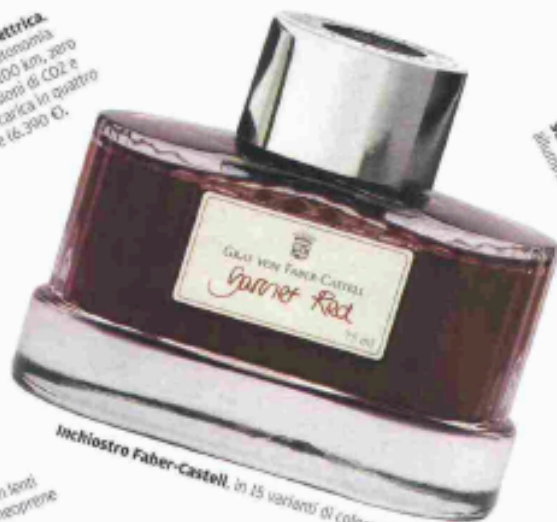
Inchiostro Faber-Castell, in 15 varianti di colore (27 €).