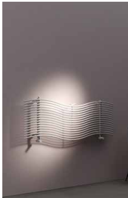
VERSIÓN HIDRÁULICA ESTÁNDAR (Fijaciones OB1)