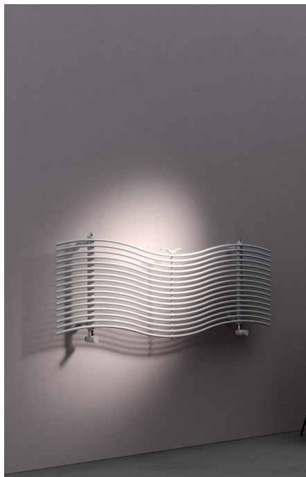
VERSIÓN HIDRÁULICA ESTÁNDAR (Fijaciones OB1)