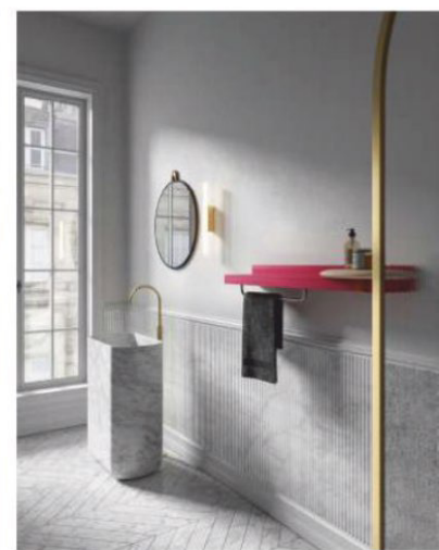
« Rift/reverse », étagère-radiateur modulaire, puissance 300 W, à partir de 1140 €, design Ludovica + Roberto Palomba et Matteo Fiorini, Tubes .