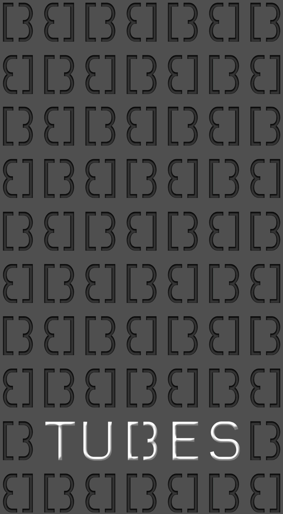
TABELLA COLORI EVE - EVE COLOURS CHART