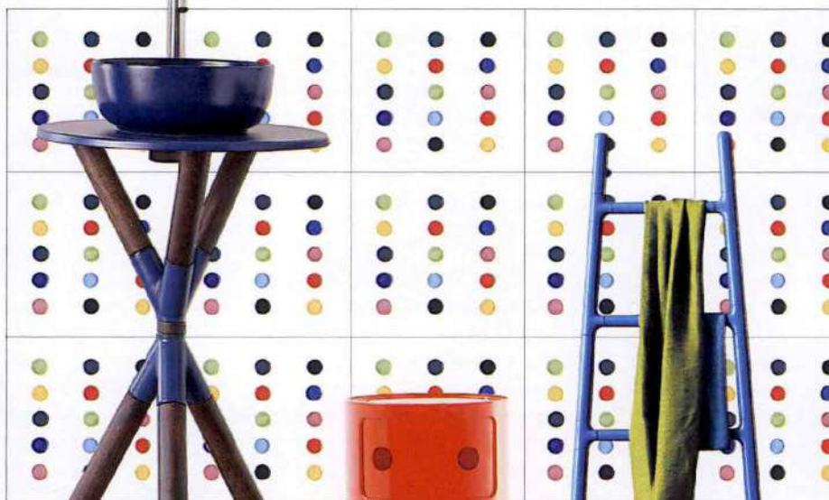
Lavabo Coll. Cross di Scarabeo ( www.scarabeosrl.com ).