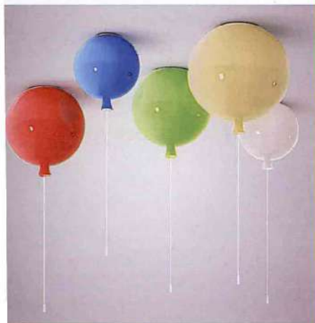
Plafoniere a palloncino colorato di Liunian, in vendita su www.amazon.it

Come in tutti gli ambienti della casa, anche in bagno l'illuminazione ideale si ottiene con diverse fonti luminose: una generale, e altre più puntuali e funzionali a determinate operazioni e zone come quella con lo specchio, dove è preferibile una luce tecnica, bianca e performante, che non abbagli e non crei riflessi. Quella principale può essere più morbida, ottenuta in questo caso con diffusori colorati che sembrano palloncini, perfetti nel bagno "juniores".