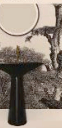
Edonite. Ogni modello in acciaio o in ceramica. Linea design Alto in Tonda