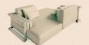
Espresso. Vis-à-vis Magister di Ludovica Mascheroni