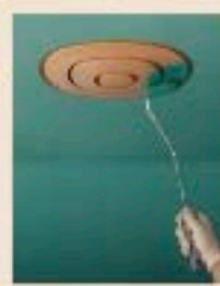
Leggenda. Ogni modello in acciaio o in ceramica. Linea design Alto in Tonda