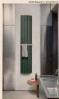
Mimoteo. Ogni modello in acciaio o in ceramica. Linea design Alto in Tonda