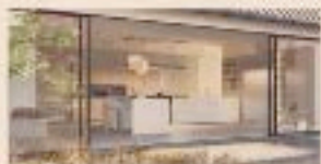
Libera. Un'ampia gamma All-around di Domo Cucine