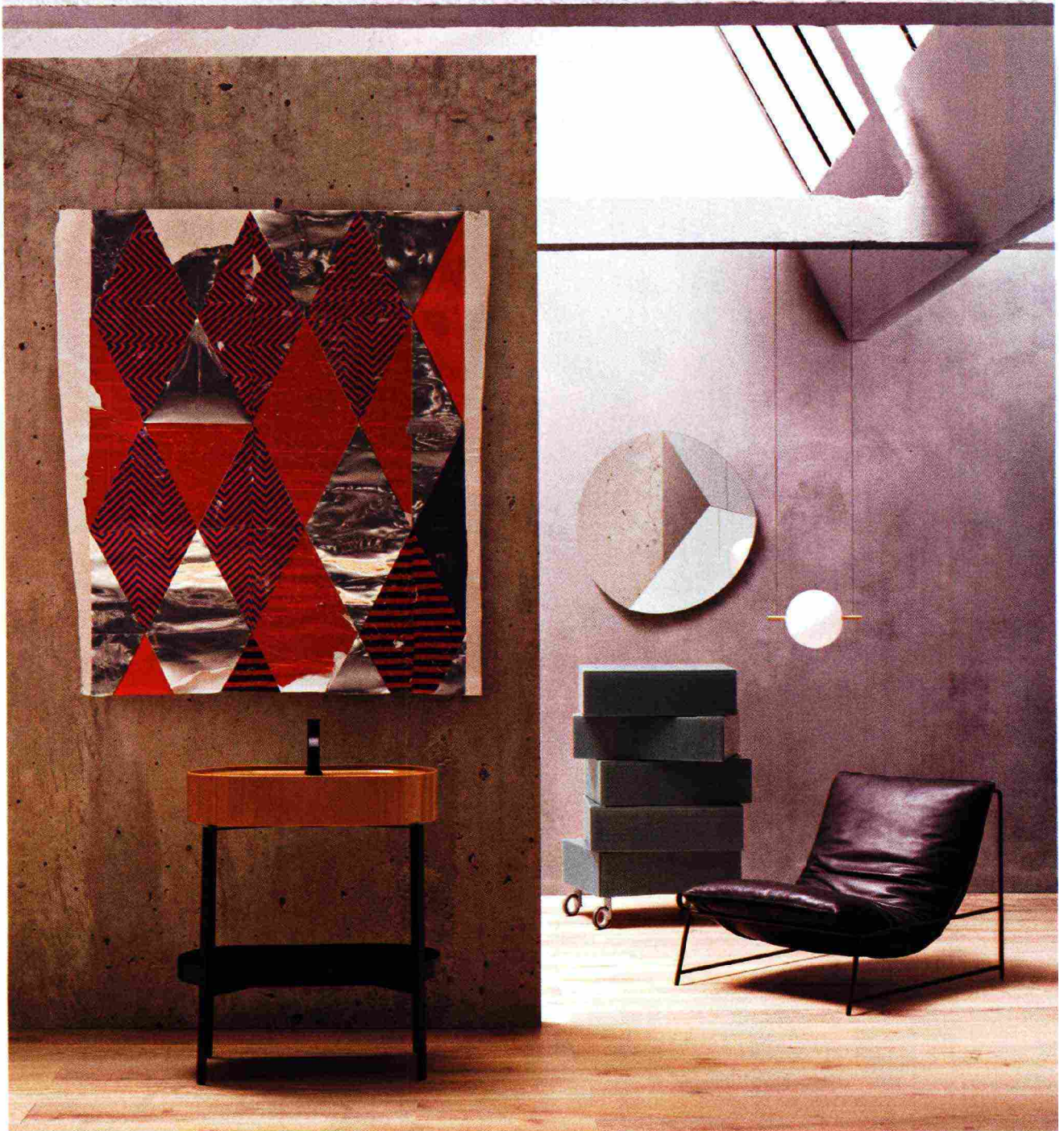
Lavabo Consolle 70 free standing con bacino in ceramica finitura glossy, struttura e vassoio in acciaio, miscelatore Solo, tutto Nic Design. Specchio sfaccettato Circle con superfici inclinate, Riflessi. Contenitore su ruote Morgana in laccato e vetro lucido con cassetti che ruotano, Daniele Lago per Lago. Lampada a sospensione Alma in vetro e ottone spazzolato, design Matteo Cibic per Il Fanale. Poltrona Rito con struttura leggera in tondino di metallo e ampio cuscino imbottito rivestito in pelle, design Matteo Thun e Antonio Rodriguez per Désirée. Out of Stock, 2019, pittura e collage su carta, opera di Paolo Gonzato, courtesy APalazzo Gallery