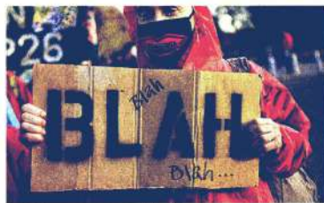
Cop26. La conferenza Onu sul clima fino al 12 novembre in Scozia

Domani Cop26 al via LA SCOMMESSA DI GLASGOW: IL CLIMA OLTRE LE PAROLE