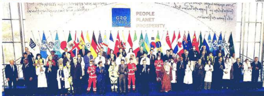
Grandi e angeli del Covid. Leader uniti sull'obiettivo del 70% del mondo vaccinato entro il 2022. Merkel: «Splendida l'idea della foto di gruppo con medici e soccorritori»